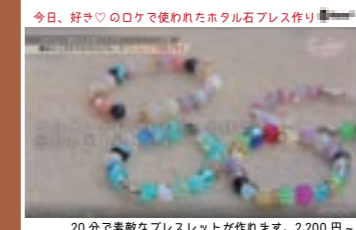
20分で素敵なブレスレットが作れます。2,200円-